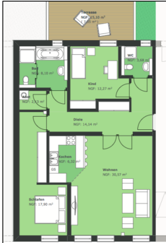
WE-Nr. 1: 3 Raumwohnung mit Terrasse und Garten im Erdgeschoss