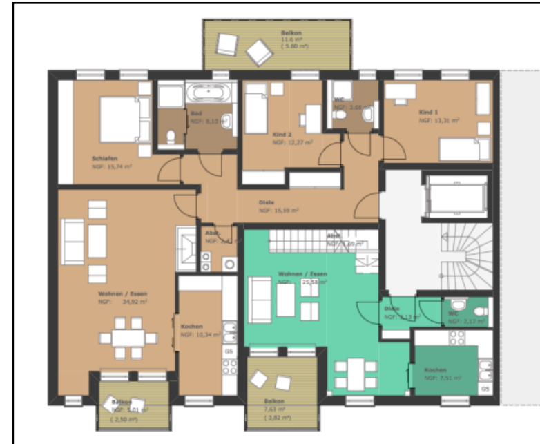
WE-Nr. 2 / 4 / 5: 4 Raum-Etagen-Wohnung mit 2 Balkonen (ein Balkon gen Süden)